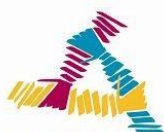
Europejski Rok Wolontariatu 2011